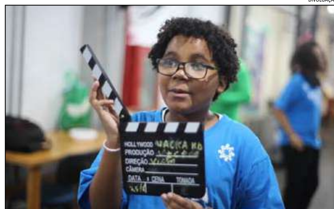
• Super Hacka Kids promove cursos de Cinema

O processo seletivo será realizado em duas etapas: inscrições on-line com seleção baseada nos pré-requisitos divulgados