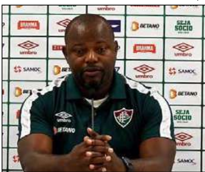
• Tricolor perdeu última partida sob seu comando

O Brasileirão retorna na quarta-feira (13) e o Fluminense enfrenta o Vasco no sábado (16), às 16h, no Estádio Nilton Santos.