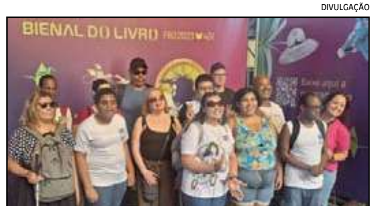
• Visitas continuam durante a Bienal

Os interessados devem chegar 15 minutos antes da abertura do evento e dirigir-se ao balcão Visita Guiada, próximo ao Pavilhão Laranja.