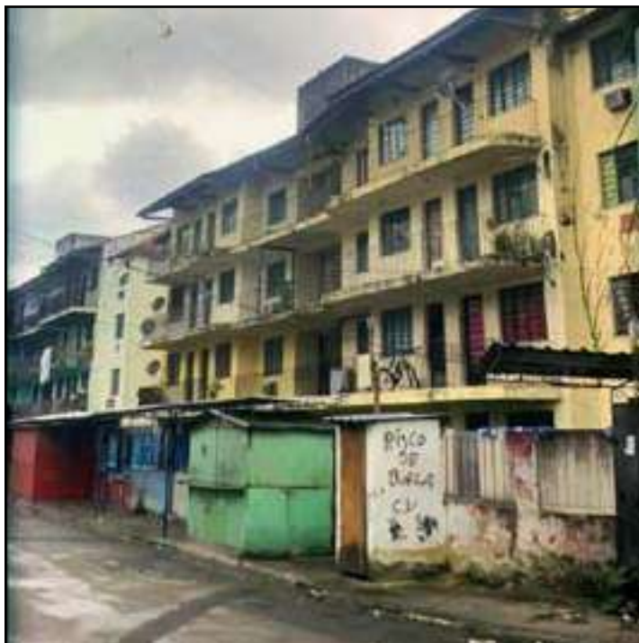
• Traficantes que atuam na comunidade Chatuba vendiam pacotes clandestinos de internet

mento do serviço pelas prestadoras, os criminosos cortam os cabos que levam o sinal ao cliente. Dessa forma, eles mantêm a pró-