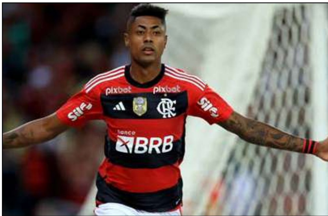
• Olympiacos já oficializou a proposta de pré-contrato

BH deixa claro nos bastidores que pretende seguir no Flamengo por mais um tempo