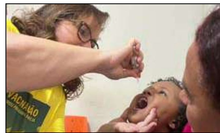
• O Dia D é uma campanha do Ministério da Saúde em parceria com a Prefeitura, pela atualização dos cartões de vacina

As vacinas são seguras e, para receber a dose basta comparecer a um posto de saúde e apresentar o cartão de vacinação e o CPF. Apenas pessoas com sintomas gripais, como tosse, espirros, coriza, dor de garganta e febre, devem adiar a imunização. O Dia D da Vacinação teve como público alvo principal as crianças