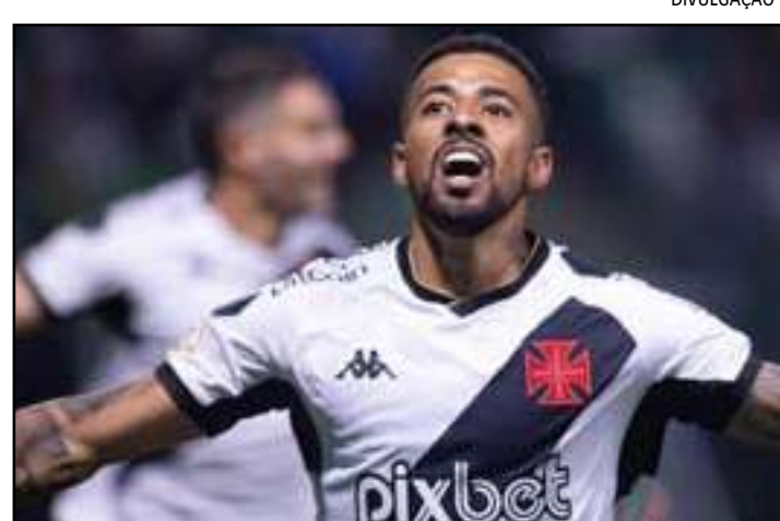
• Jogador tem sido grande destaque do time