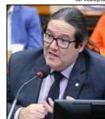
• Deputado federal Tarcísio Motta

A briga entre os colegas de legenda foi acirrada. Inicialmente, tentou-se articular o nome de Motta sem as tradicionais prévias, mas Renata, também de olho na vaga, se mobilizou para manter a disputa. As plenárias escolheram 59 delegados, que definiram hoje o processo de escolha. O deputado federal já havia concorrido ao governo do estado pela legenda em 2014 e 2018. Desta forma, o Psol come-