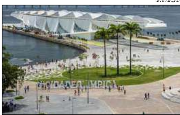
• Marca é referente aos primeiros 8 meses de 2023

Uma pluralidade de atrações temporárias que estiveram em cartaz este ano contribuíram para o aumento significativo de público: a exposição “Sebastião Salgado – Amazônia”, antes de se despedir no dia 12 de fevereiro, encantou durante boa parte das férias escolares no início do ano; “Celular 50”, que ficou em cartaz até 20 de agosto, contou a história do aparelho desde sua primeira versão; a mostra de literatura expandida “Sai-Fai”, que segue até 12 de novembro, além da instalação “Cidade na Floresta”, da