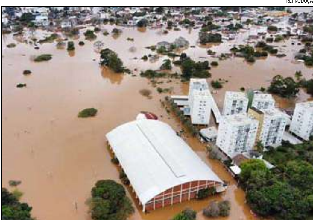
• Em muitas cidades do estado, o cenário é desolador

o volume das chuvas, o rio Taquari transbordou e atingiu imóveis e estradas.