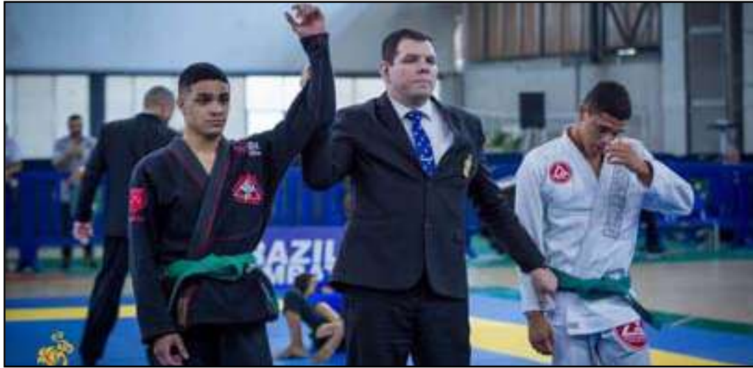
• Lutador detém premiações nacionais e internacionais