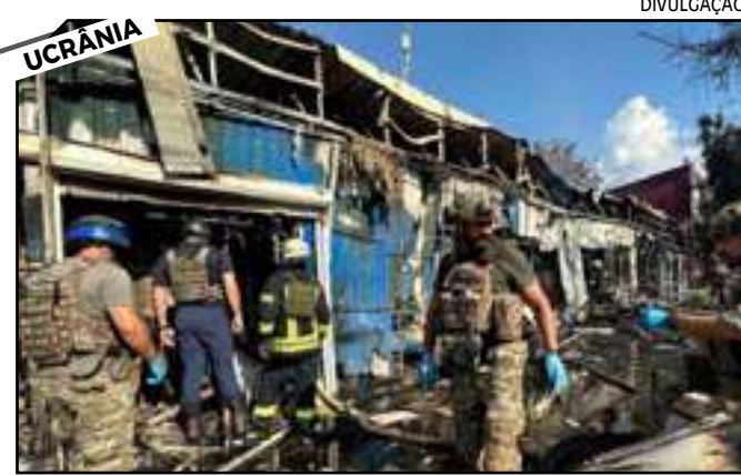
• Bombardeio russo atingiu um mercado de Konstantinovka

Ao menos 16 pessoas morreram nesta semana em um bombardeio russo que atingiu um mercado de Konstantinovka, cidade do leste da Ucrânia, anunciou o presidente Volodimir Zelensky nas redes sociais.